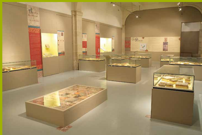
Exposition temporaire Carreaux de pavements , 2014