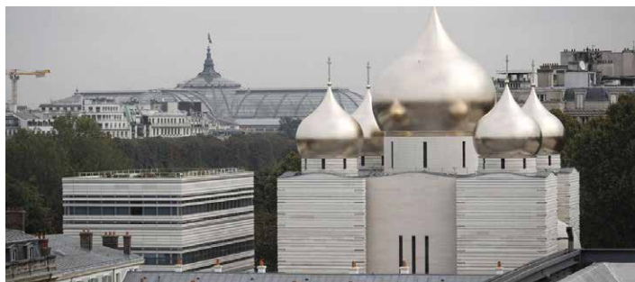
La cathédrale orthodoxe du quai Branly

Inscriptions à la Maison du Tourisme , 16, rue Aristide Briand à Troyes le mercredi 4 octobre 2017 à partir de 9h30 puis par téléphone au 03 25 73 39 22 ou 06 77 78 87 71 à partir de 14 heures (en fonction des places disponibles)