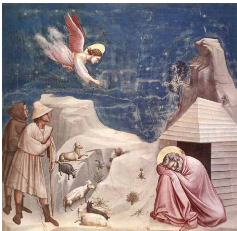
GIOTTO, Padoue, Le songe de Joachim , 1302-05

Cette conférence propose de découvrir comment les maîtres italiens du Trecento ont bouleversé la peinture européenne. Au siècle où dominaient encore les canons byzantins, les peintres toscans s'imposent comme les créateurs d'un nouveau langage pictural, directement inspiré de la réalité du monde visible. Les expériences alors menées sur la perspective, la narration ou le portrait débouchent sur une profonde humanisation de la peinture religieuse. Explorer cette humanisation à travers les œuvres de Cimabue, Giotto ou les maîtres siennois nous permettra de comprendre pourquoi les maîtres du Trecento ont été considérés comme les fondateurs de la modernité en peinture.