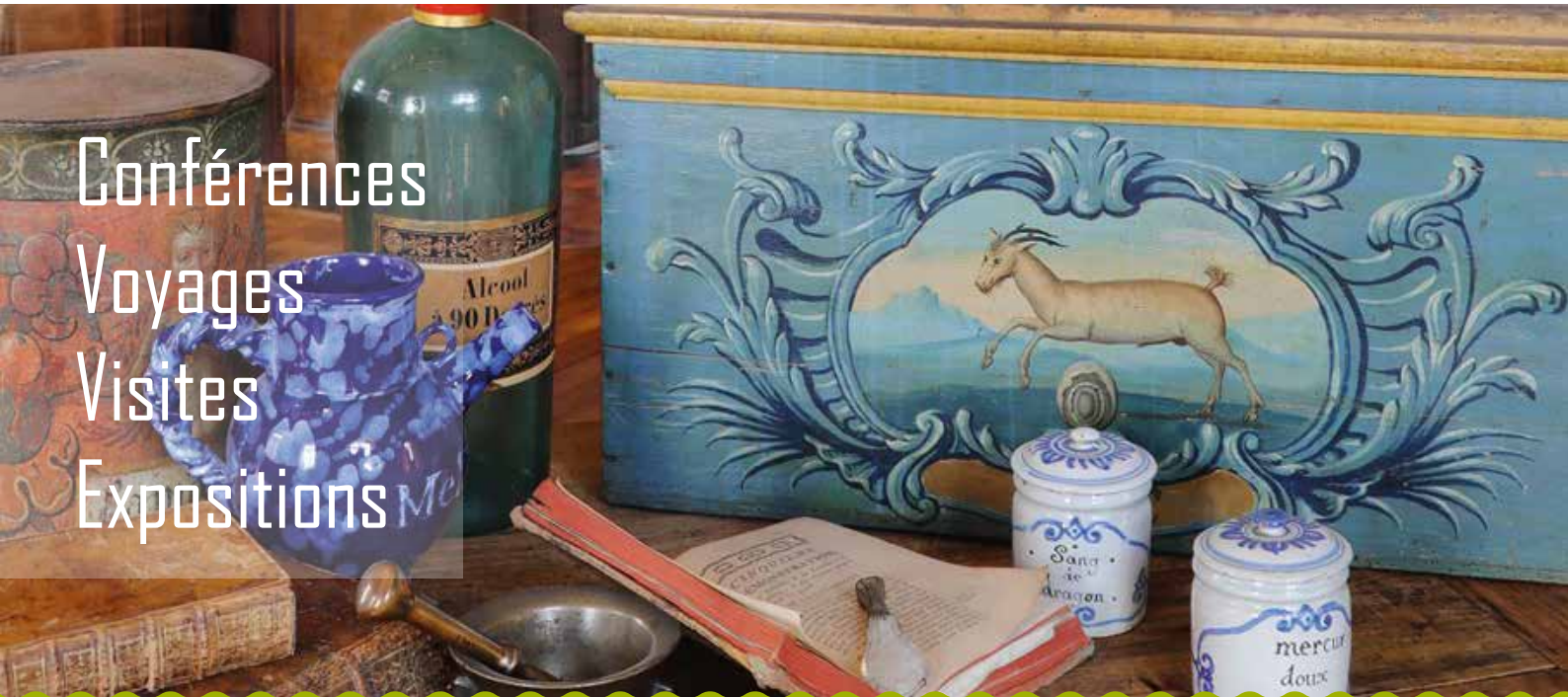
Apothicaire de l'Hôtel-Dieu-le-Comte