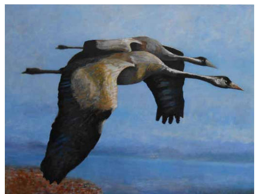
Le vol perpétuel , 114 x146 cm, acrylique et huile sur toile

Le vol des grues cendrées, une rencontre inattendue entre les vestiges de l'histoire et la légèreté animale traduite par les pinceaux de Jean Kiras.