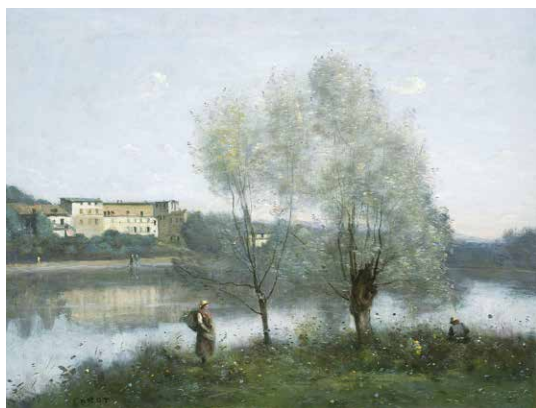
Jean-Baptiste Camille Corot, Ville d'Avray, 1865 , National Gallery of Art à Washington

Au début de l'exode rural, les campagnes commencent à se vider de leurs paysans et deviennent un lieu de villégiature pour les citadins aisés. Dans la forêt de Fontainebleau, à Barbizon, des peintres se retrouvent pour des promenades vespérales, des