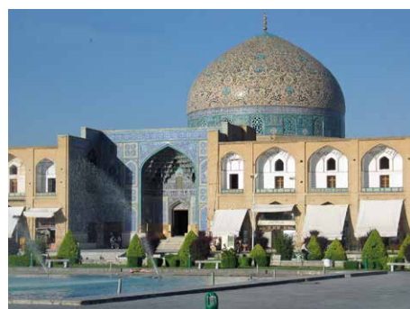
Mosquée Sheik Lutfullah

La dynastie des Séfévides, qui règne sur l'Iran de 1501 à 1736 connaît son âge d'or sous shah Abbas Ier le Grand qui proclame l'Islam chiite religion d'Etat. En 1598, il choisit comme capitale la ville d'Isfahan, au prestigieux passé seldjoukide, et lance un vaste plan d'urbanisme pour la doter d'un nouveau centre. C'est ainsi qu'est créée la gigantesque place royale, « image du monde », bordée de somptueux édifices telles que la mosquée de l'imam et la mosquée Lutfullah aux dômes bulbeux revêtus de céramiques turquoises. L'avenue d'apparat Chahar Bagh, longue de 4 km, que Pierre Loti considérait comme les « Champs-Élysées d'Isfahan », est bordée de