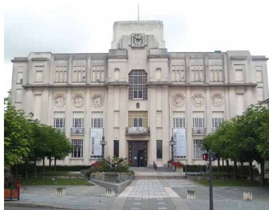
Hôtel de ville Sainte-Savine

Trois courants inspirent l'architecture de l'entre-deux-guerres : le régionalisme, l'Art déco et le modernisme. Seuls les deux premiers sont présents à Troyes durant cette période. Le régionalisme s'exprime dans les constructions suburbaines et montre des types basque, breton... qui sont en fait très